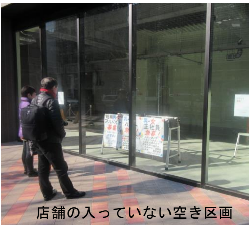
店舗の入っていない空き区画

大村市議は、元々、営業していた方たちがほとんど残っていない再開発というのは、おかしいのではないかと意見を述べました。