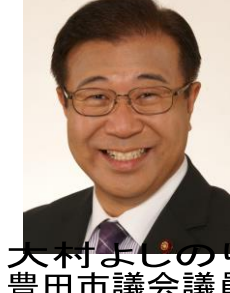
大村よしのり 豊田市議会議員