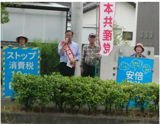
みよしで訴える支部のみなさん