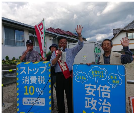
藤岡で訴える支部のみなさん