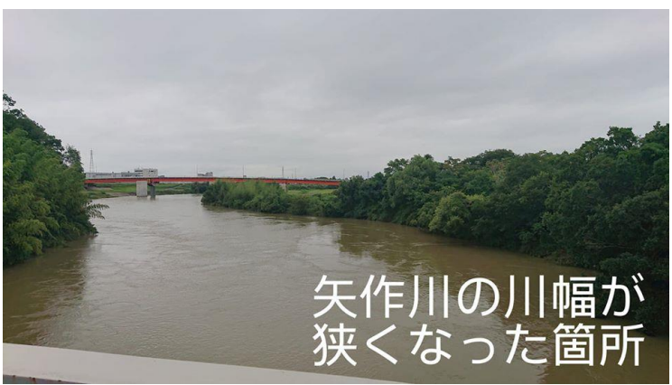
矢作川の川幅が狭くなった箇所