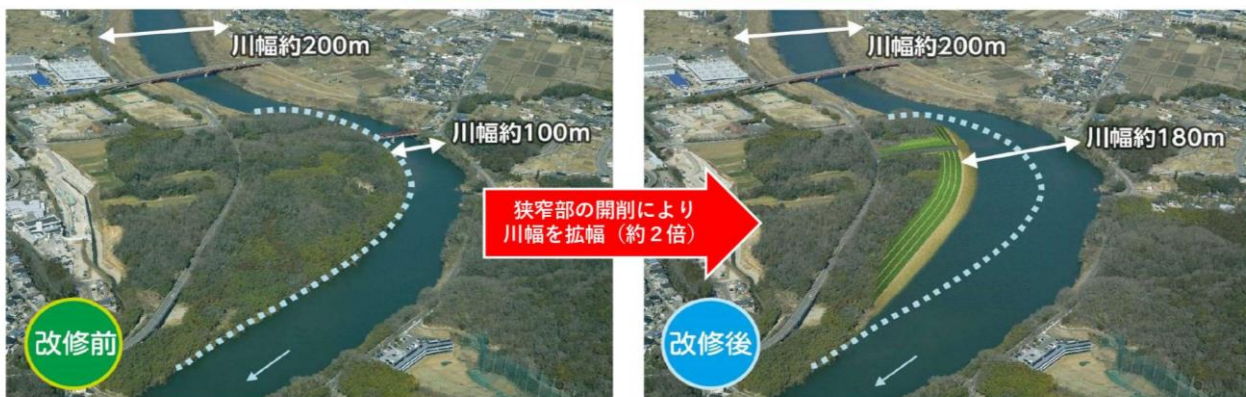
▶豊橋河川事務所パンフより引用