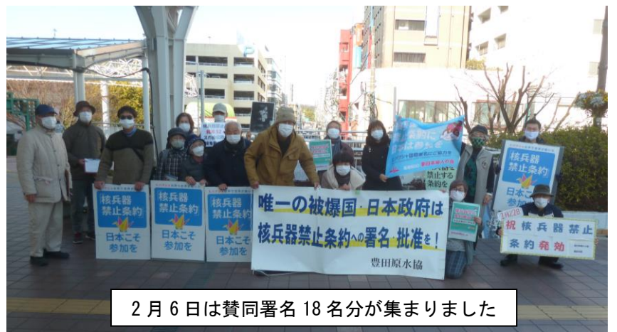
2月6日は賛同署名18名が集まりました

今は、以前と比べて様々な子ども達がいいます。コロナ感染の心配もあります。子ども達のすこやかな成長のためにも、そして教員の超過密労働改善のためにも、少人数学級の拡大を更に進めていくことが、今こそ求められていると思います。