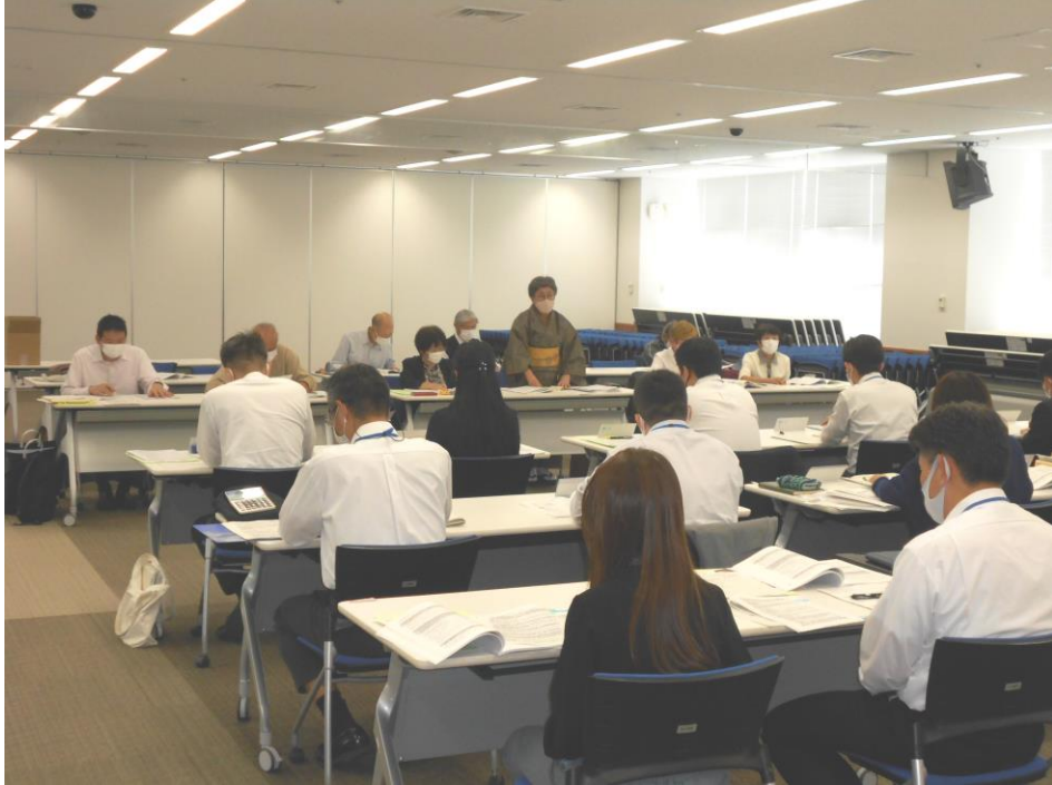
手前は回答する市の担当課。奥がキャラバン隊

県内のすべての自治体を訪問し、医療・介護・福祉など社会保障の拡充と国や県に意見書の提出を求めて要請する2021自治体キャラバン(愛知自治体キャラバン実行委員会主催)が、10月19日に豊田市で要請と懇談を行いました。今年で42回目を迎えます。懇談の際に、文書での回答を要請していますが、今回の懇談では、文書回答は懇