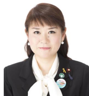
もとむら伸子 衆議院議員

◆第2土曜日は午前10時～12時 ◆法律相談は随時 ◆生活相談は根本議員が対応します ◆要予約 ◆お申し込みは根本議員か 日本共産党豊田地区委員会まで Tel.0564-231278