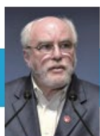
ジョゼフ・ガーソン 平和・軍縮・ 共通安全保障 キャンペーン議長