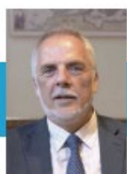
アレクサンダー・クメント オーストリア 外務省 軍備軍縮局長