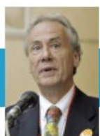
ライナー・ブラウン 国際平和ビューロー 元事務局長