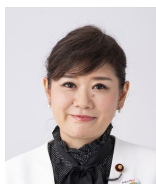
もとむら伸子 衆議院議員