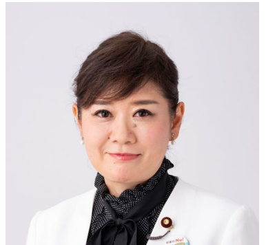
衆議院議員 もとむら伸子