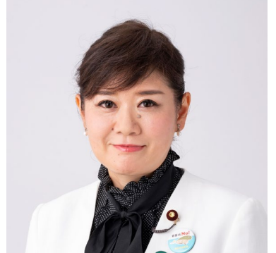
衆議院議員 もとむら伸子