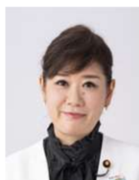
もとむら伸子 衆議院議員