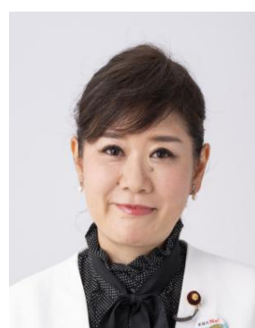
もとむら伸子 前衆院議員