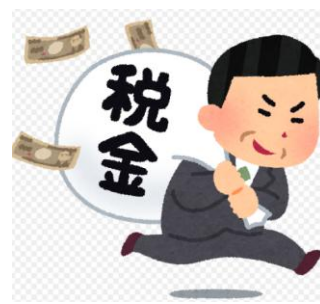
■各党の政党助成金額(2025年)

設される前から反対し、同助成金の受け取りは一貫して拒否してきました。憲法違反の巨額の交付金を受け取り続けている政党の姿勢が改めて問われています。（しんぶん赤旗より）